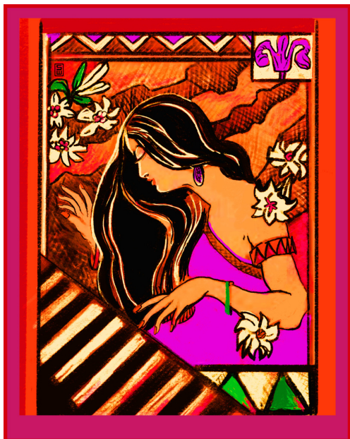
Plakatentwurf für "Jazz isch" von Silke Weiß